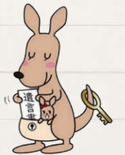
遺言書 ほかんガルー